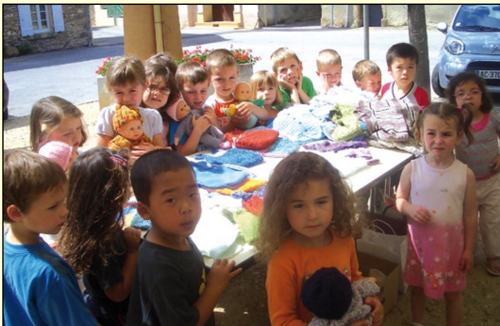
Les enfants de l'école de Saint-Laurent-La Vernède lors de la semaine mondiale du tricot.

A l'occasion de la semaine mondiale du tricot, les bénévoles d'Amis Sans Frontières Gard ont participé dans trois communes à cette manifestation. Les