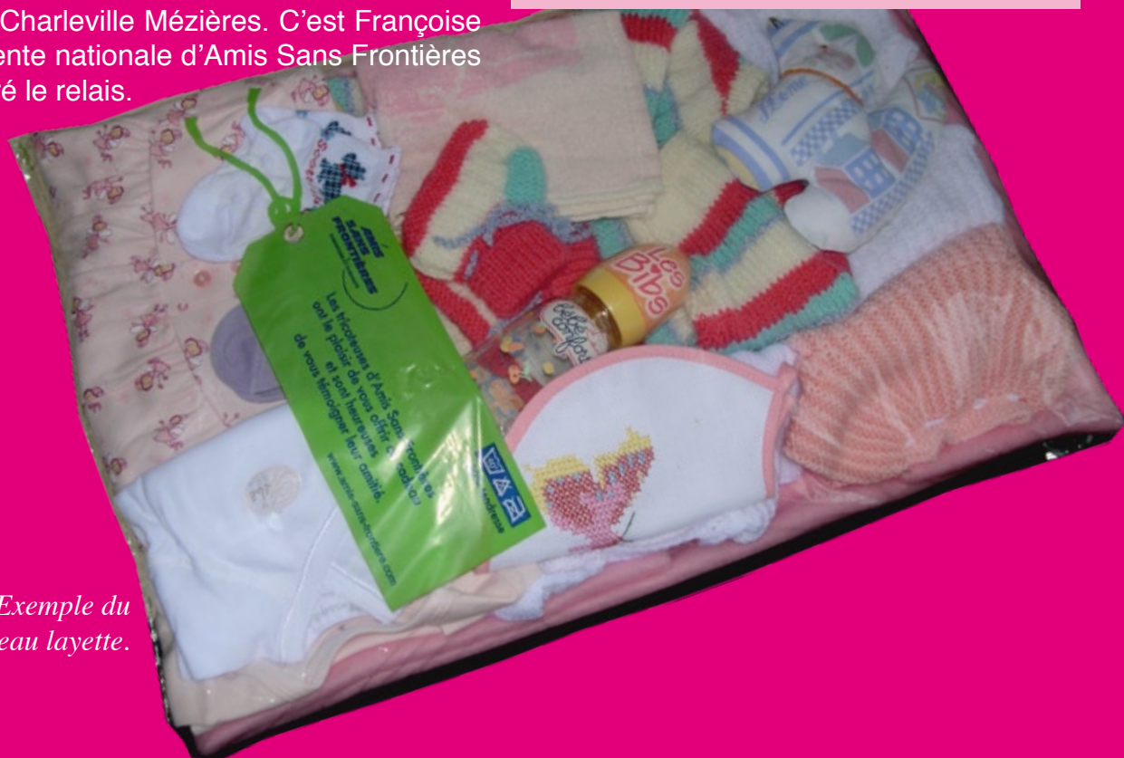
Exemple du paquet-cadeau layette.

Première quinzaine de décembre : livraison dans les organismes ou associations.