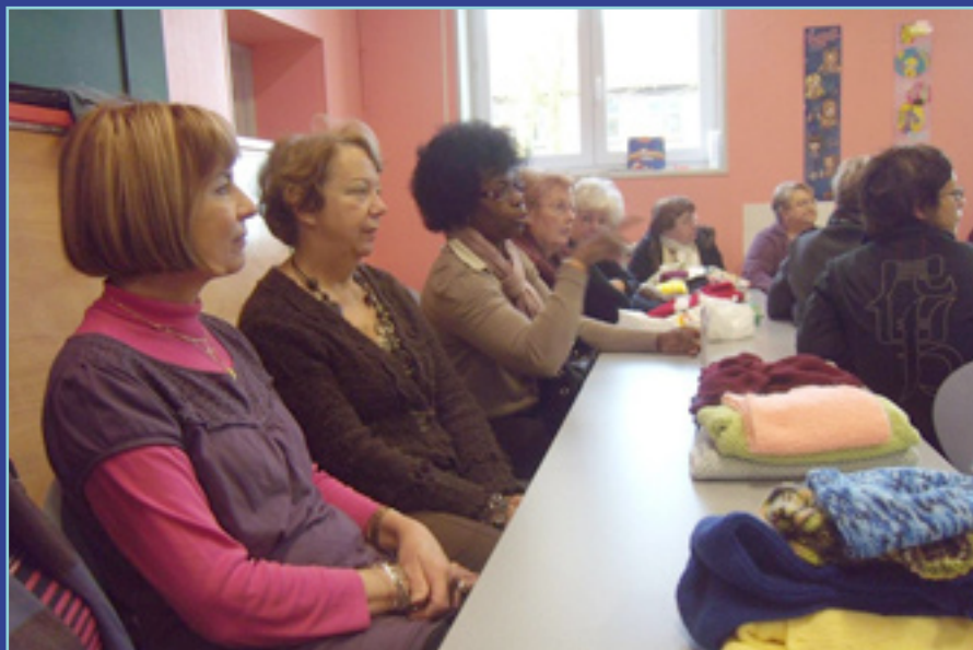
Tricoteuses et élue.