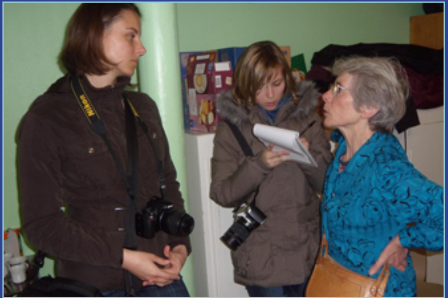
Avec la journaliste du Courrier de l'Artois.