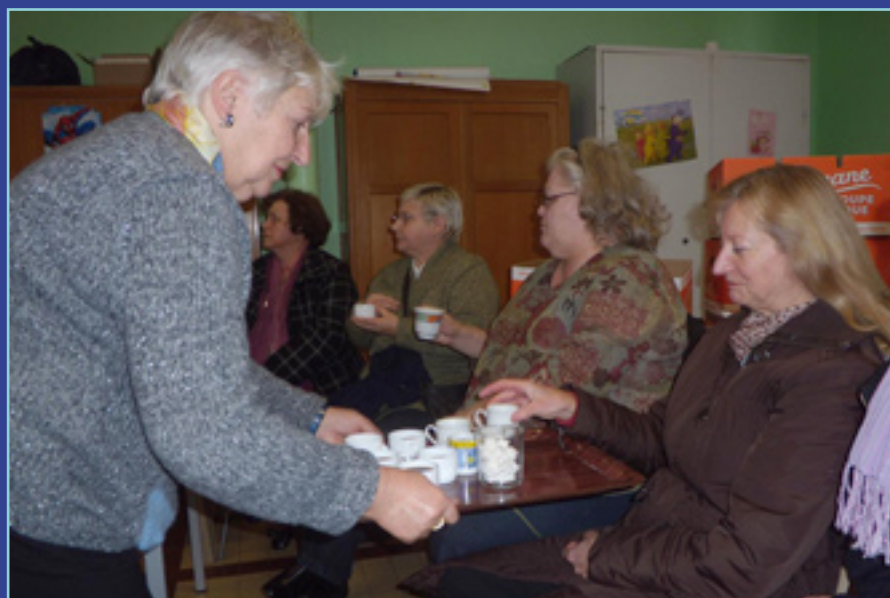
Dans le Nord pas de rencontre sans café !