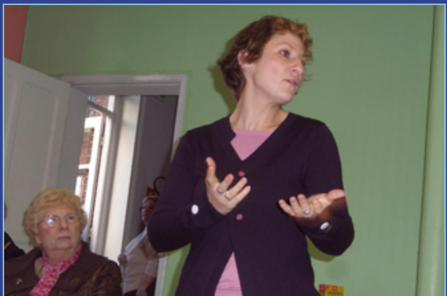
Témoignage de la représentante du foyer de jeunes travailleurs.